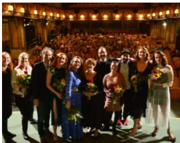
Po projekci českého snímku Sněží!