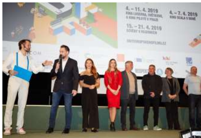
Delegace k zahajovacímu filmu Edmond režiséra Alexise Michalika